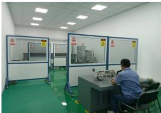
短路电流开断试验

公司建有“江苏省企业技术中心”、“南京市物联网电气设备工程技术研究中心”、“南京市智能传感电力系统工程研究中心”、“南京市工业设计中心”，研发、生产场地近 40000 平米。公司检验设备齐全完善，研发设备齐全，建有高压绝缘实验室、短路电流开断实验室、局放实验室、以及数据监控中心、运维集控中心等，配置智能型全自动真空断路器生产线 1 套，全绝缘、全密封式充气开关设备生产线 1 套，激光切割机，母线加工设备各 1 台，智能型焊接机器人 5 台，全自动等压仓式充气检漏设备 1 台等先进设备用于新产品生产。配置 150kV 高压绝缘测试设备、洛氏硬度测试机、弹簧拉压机、大电流发生器、真空断路器特性测试仪、弹簧机构测试台、轻型高压试验变压器、开关机械特性测试仪等齐套设备用于新产品的测试，研发设备原值达 812 万元。