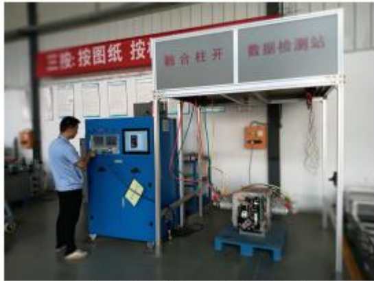
智能控制单元数据检测

公司十分重视对科研项目的资金投入，研发费用逐年稳步按照资金预算进行拨付和投入。2021 年企业销售收入 28977.21 万元、利润总额为 3404.83 万元、研发经费投入 1007 万元，研发投入占主营业务收入比例平均为 3.5%。